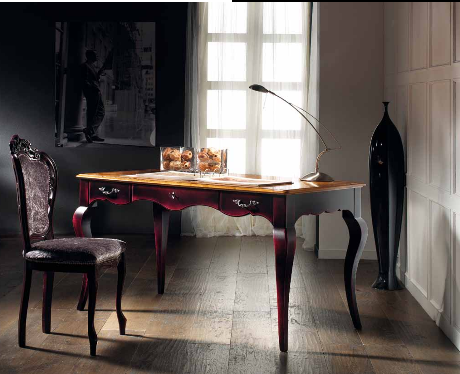
LT 125 Scrittoio 3 cassetti/ Writing desk 3 drawers cm 150 x 75 h. 78