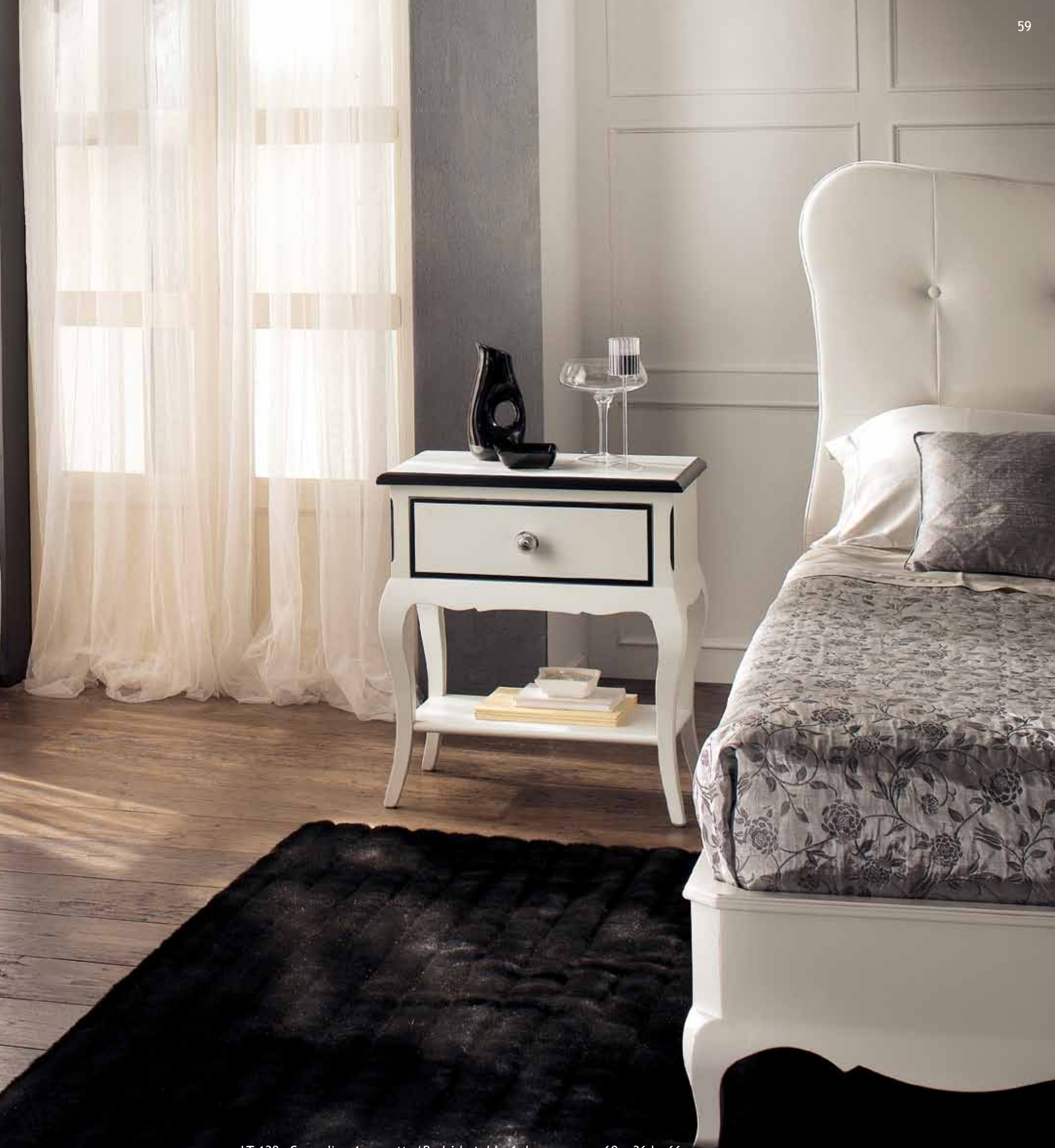
LT 138 Comodino 1 cassetto/Bedside table 1 drawer cm 60 x 36 h. 66