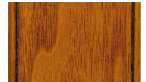
Noce Finitura Gommalacca