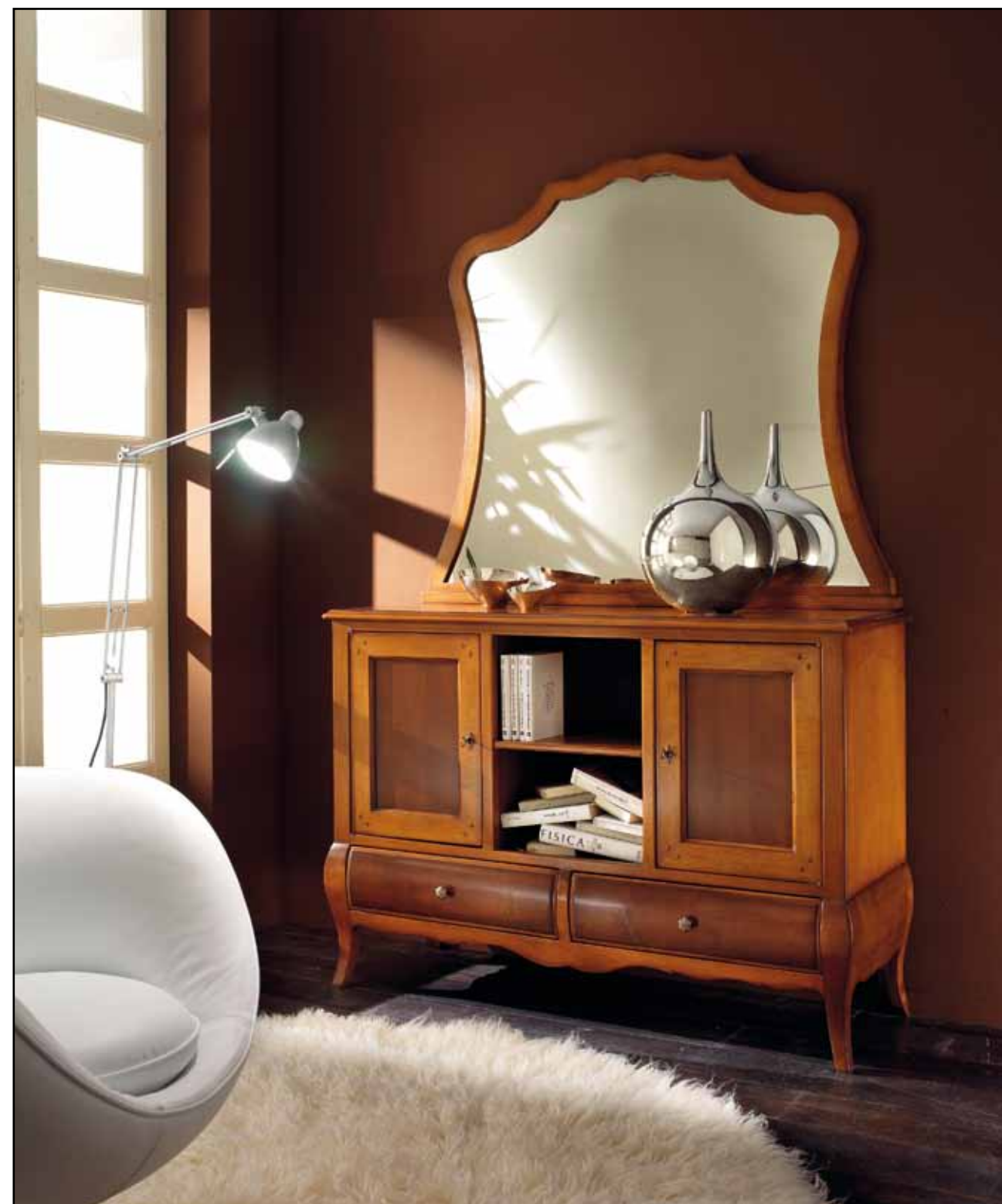
LT 110 Ingresso 2 ante 2 cassetti/Sideboard 2 doors 2 drawers LT 110S Specchiera/Mirror