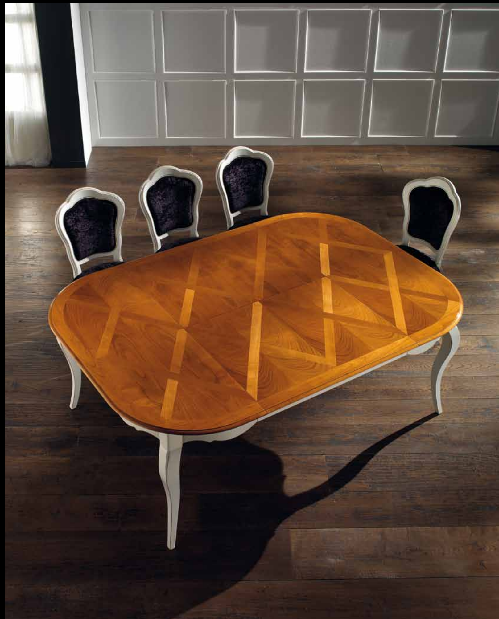
LT 123 Tavolo ovale all./Extensible oval table cm 150 x 115/207 h. 78