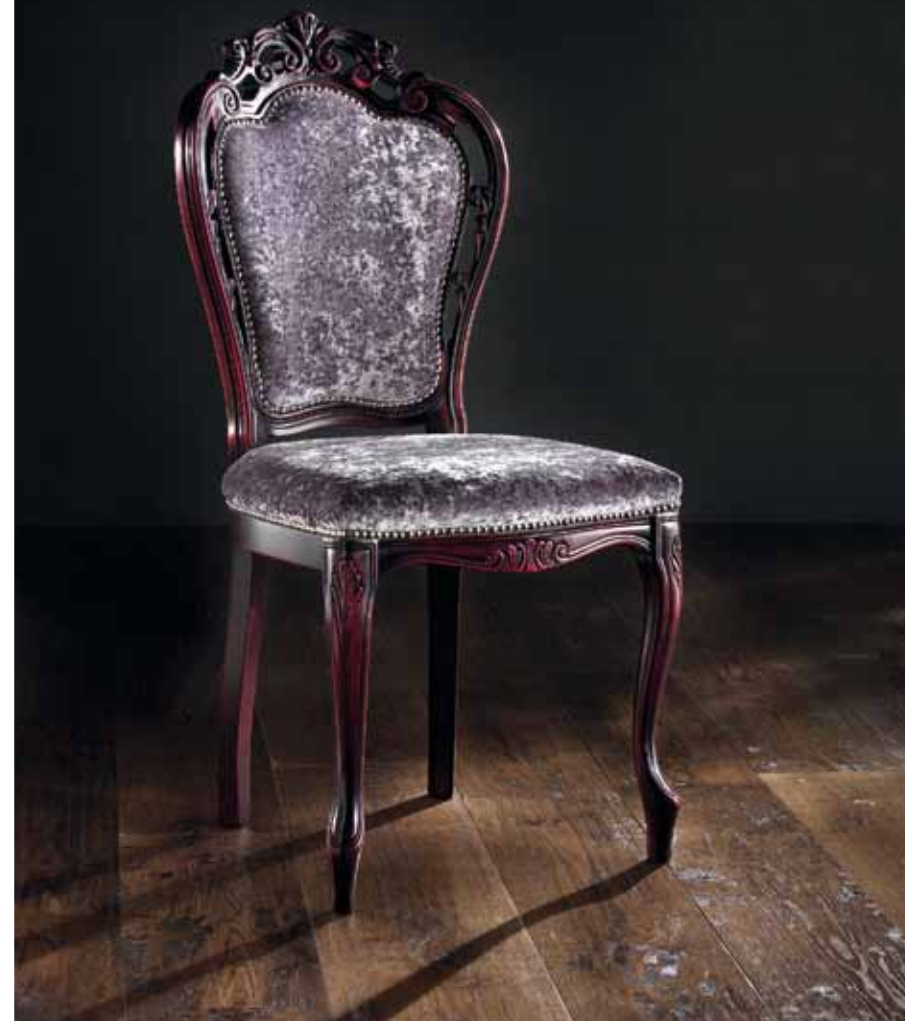
LT 161 Sedia tessuto velluto grigio 26 Chair with grey velvet fabric 26