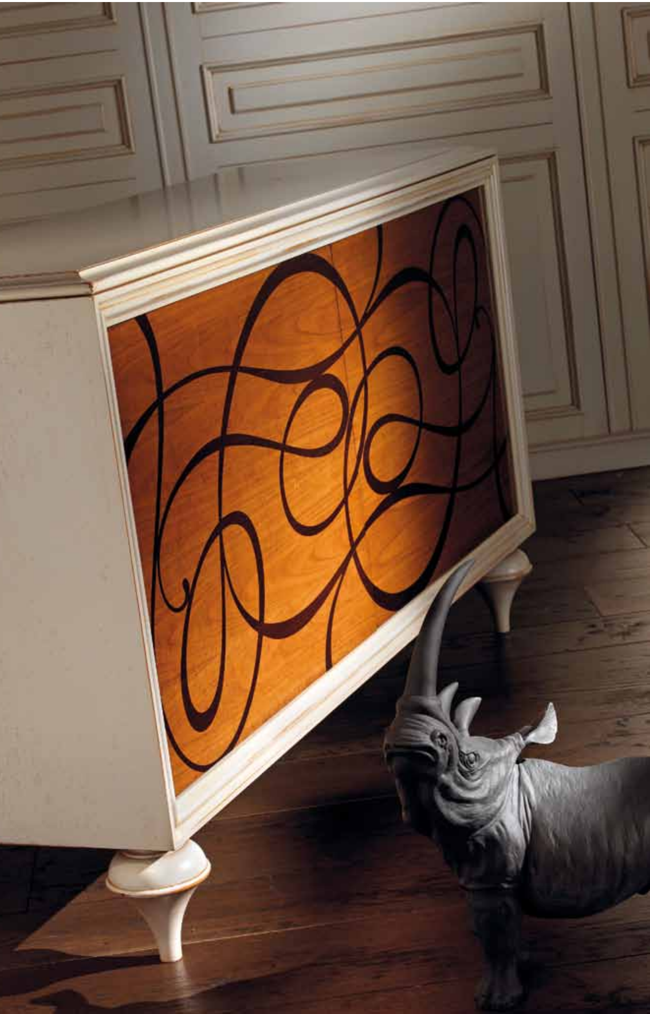
LT 100 Credenza 2 ante/Sideboard 2 doors cm 169 x 54 h. 98