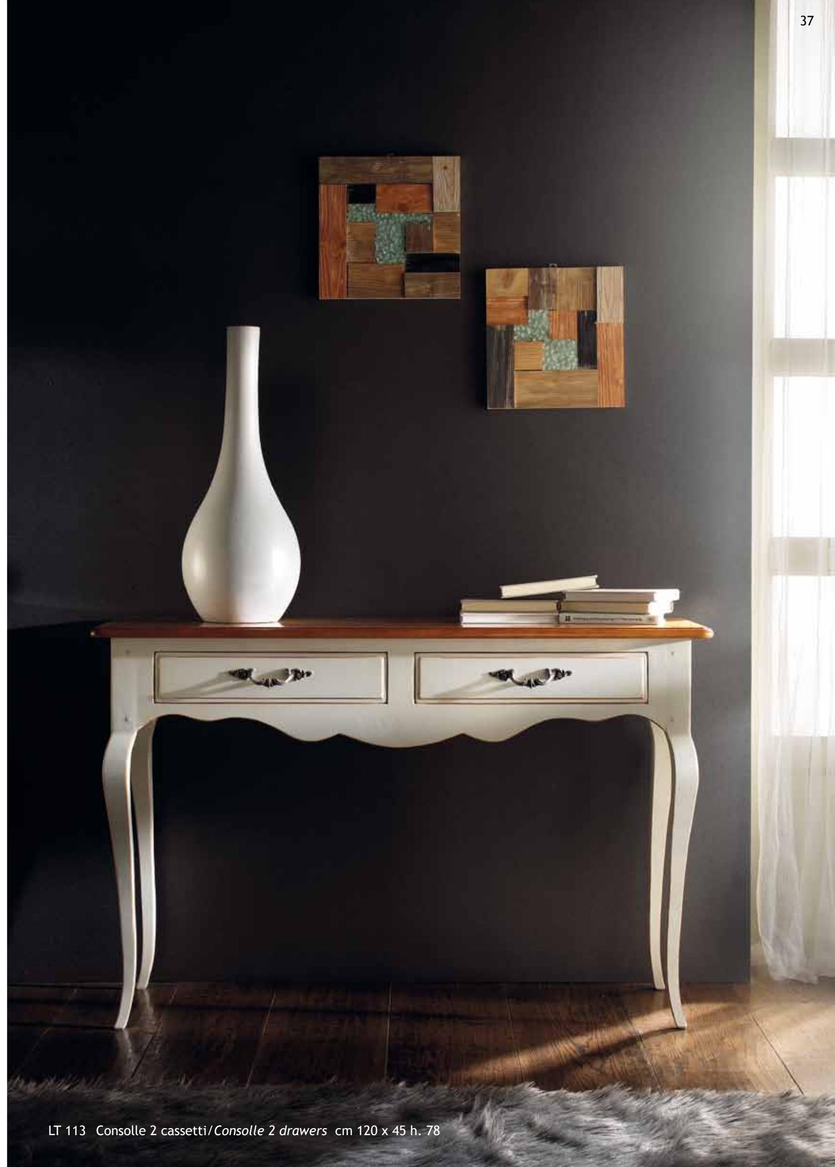
LT 113 Consolle 2 cassetti/Console 2 drawers cm 120 x 45 h. 78