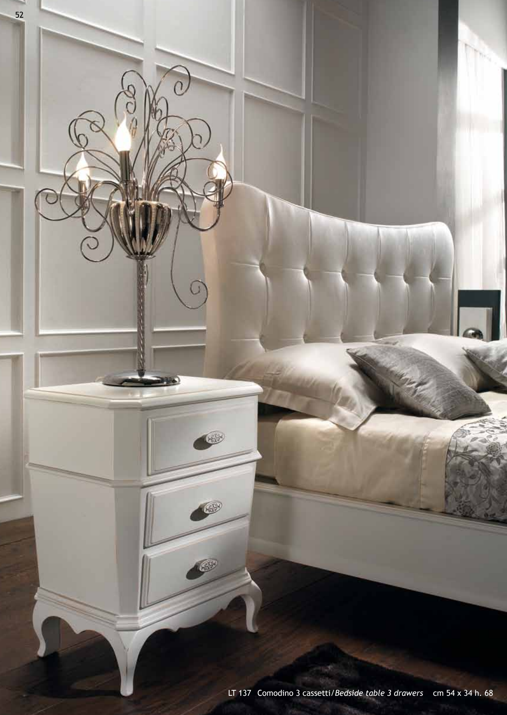
LT 137 Comodino 3 cassetti / Bedside table 3 drawers cm 54 x 34 h. 68

La camera da letto affronta il nuovo millennio con spirito giovane. LOTUS, infatti, punta su uno stile che crede più nell'eleganza e nella ricercatezza dei materiali e dei particolari che sull'effetto scenografico fine a se stesso; uno stile che non lascia nulla al caso e che crea un legame forte e armonico tra mobili, complementi e accessori, per un risultato di alto livello.