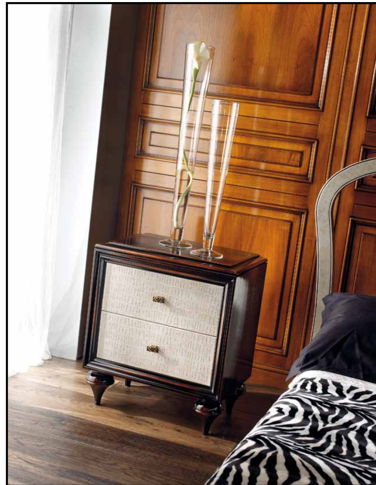
LT 133 Comodino 2 cassetti / Bedside table 2 drawers cm 60 x 40 h. 69