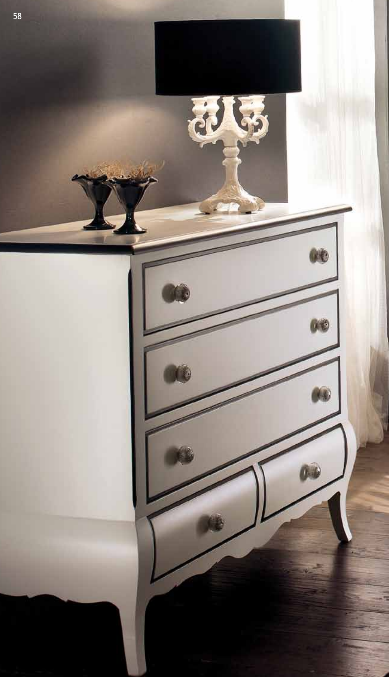
LT 131 Comò 5 cassetti/Chest of 5 drawers cm 124 x 50 h. 99