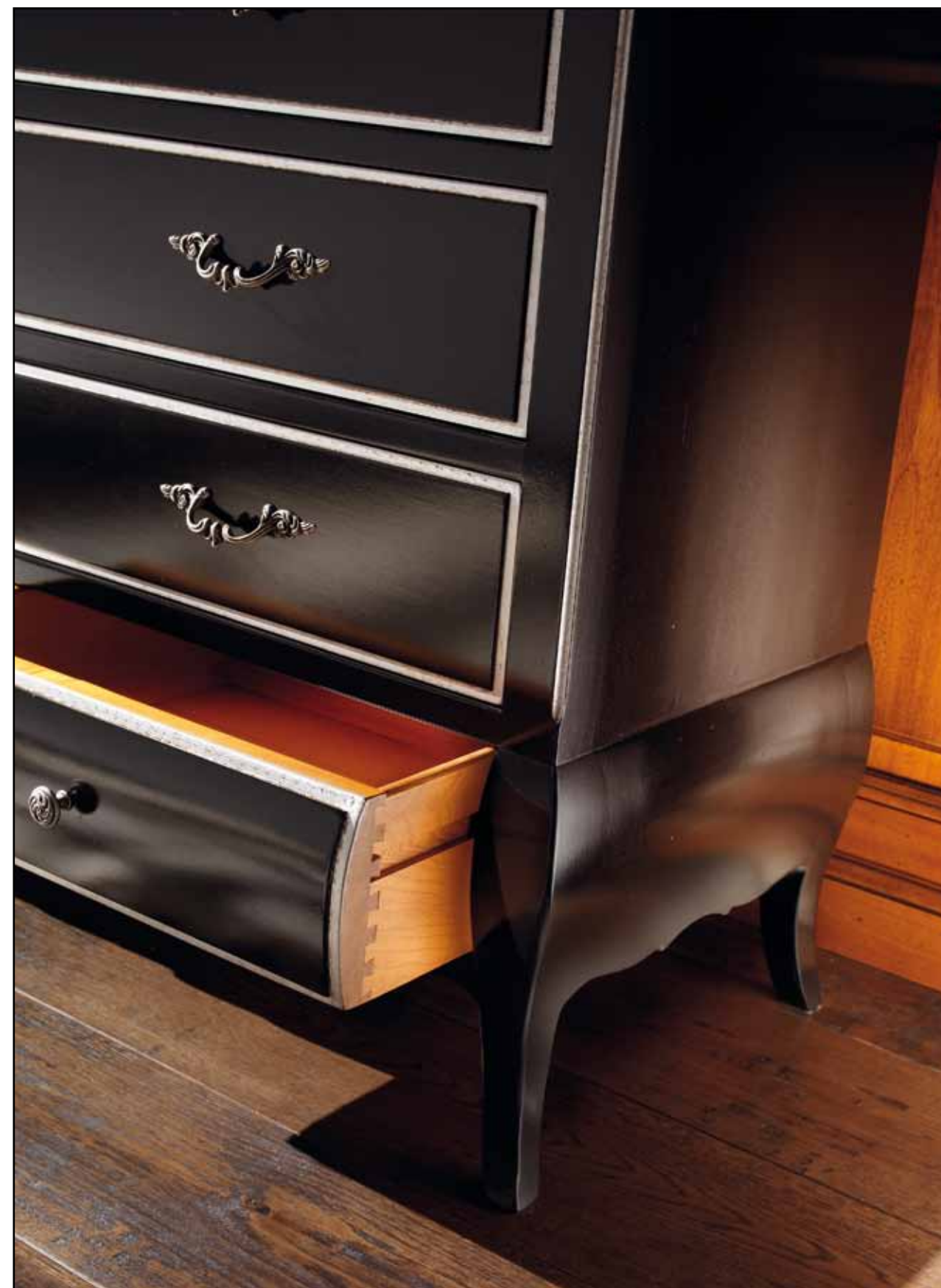
LT 131 Comò 5 cassetti / Chest of 5 drawers cm 124 x 50 h. 99