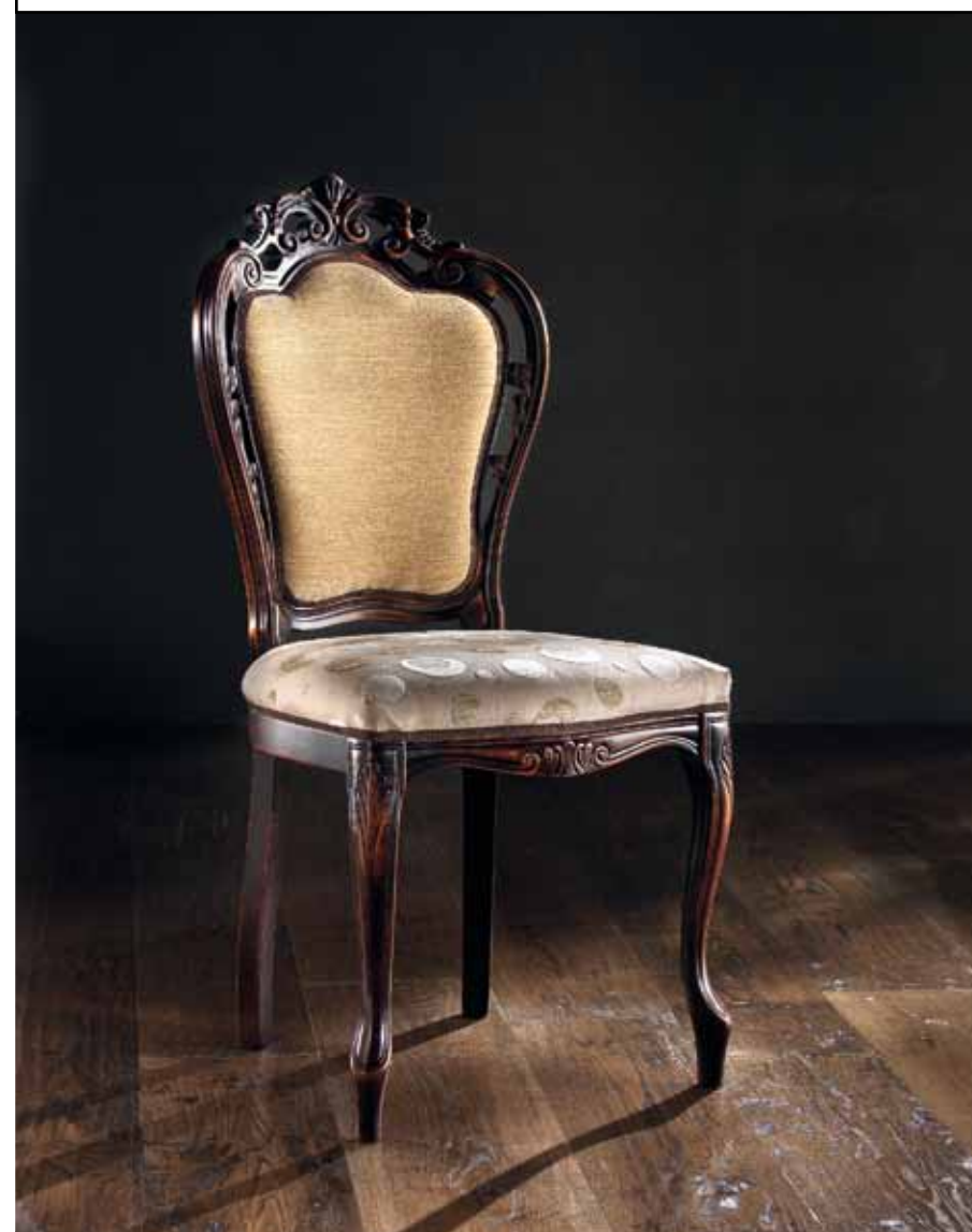
LT 161 Sedia tessuto lino/velluto nocciola 27-28 Chair with light brown linen/velvet fabric 27-28