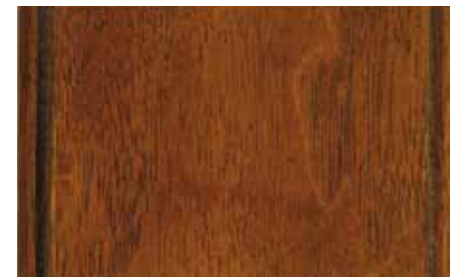
Noce Chiaro Classico