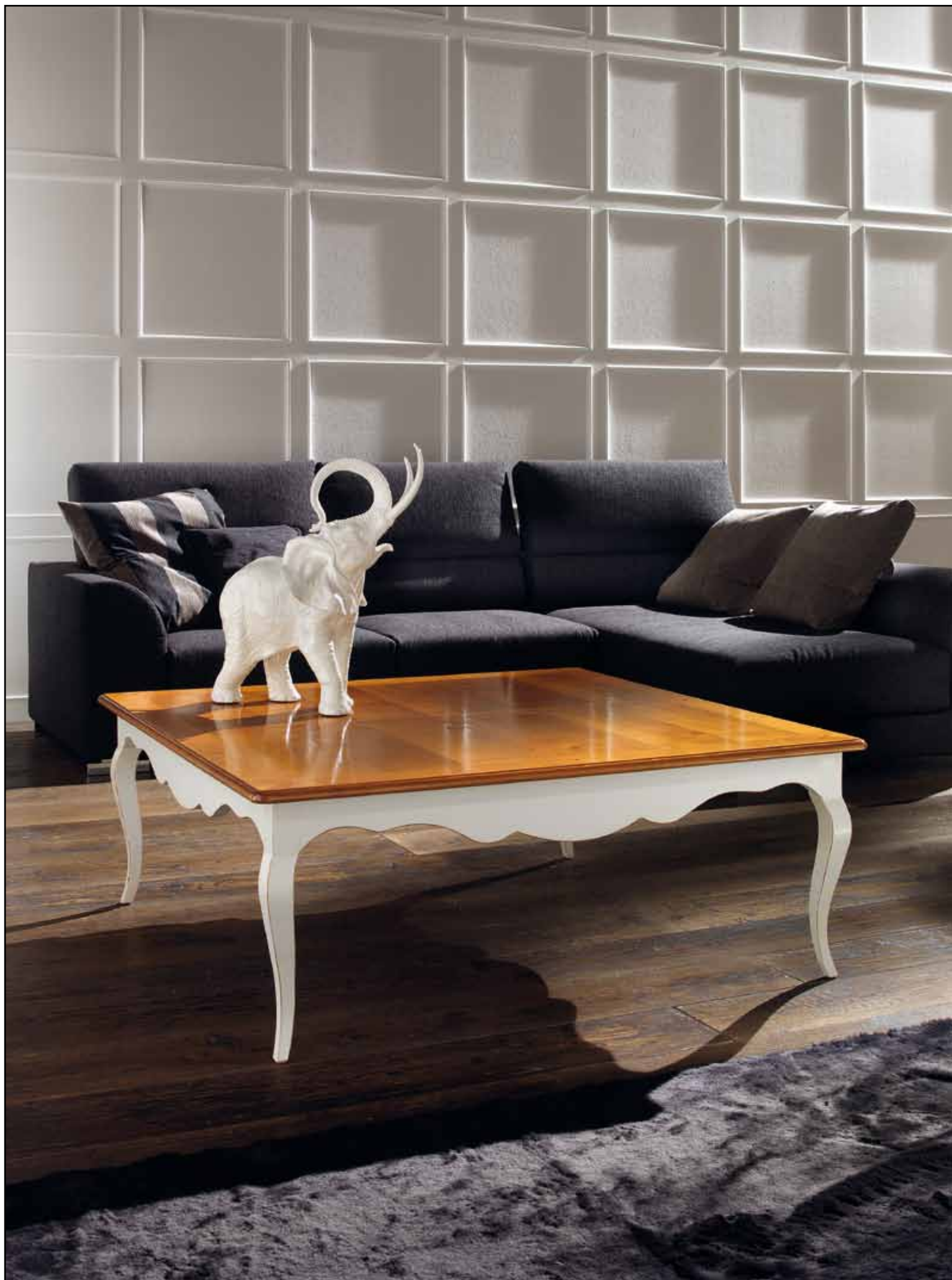
LT 124 Tavolino quadrato/Square coffee table cm 120 x 120 h. 46