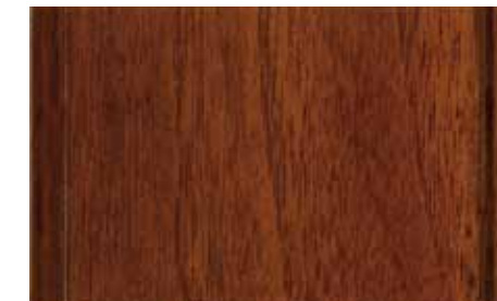
Noce Scuro Classico