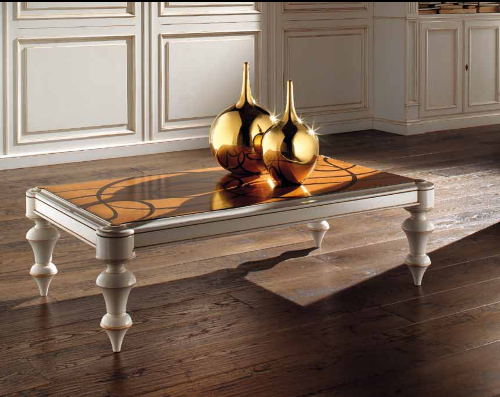
LT 121 Tavolino rettangolare/Rectangular coffee table cm 146 x 80 h. 42