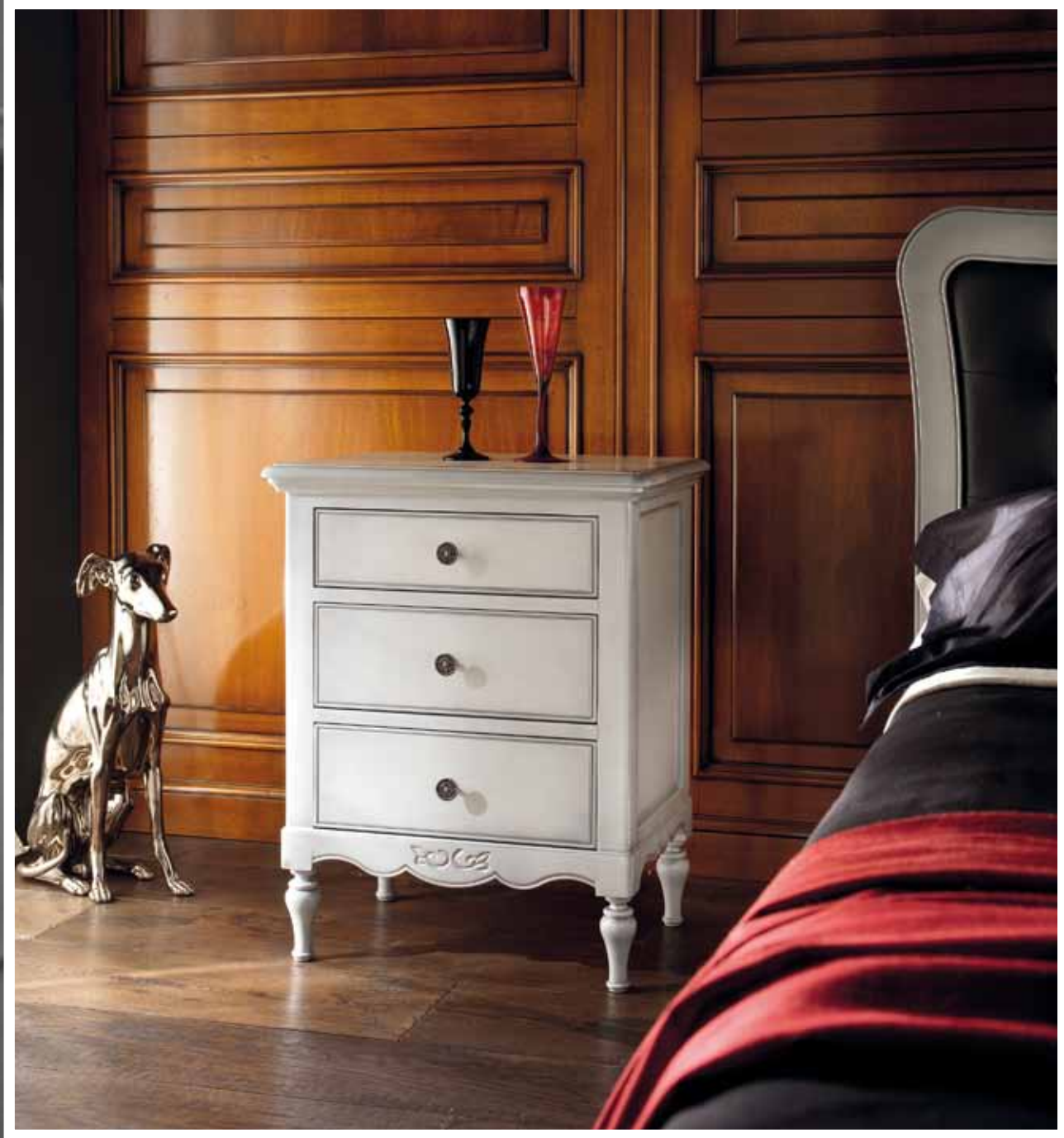
LT 136 Comodino 3 cassetti/Bedside table 3 drawers cm 56 x 40 h. 70