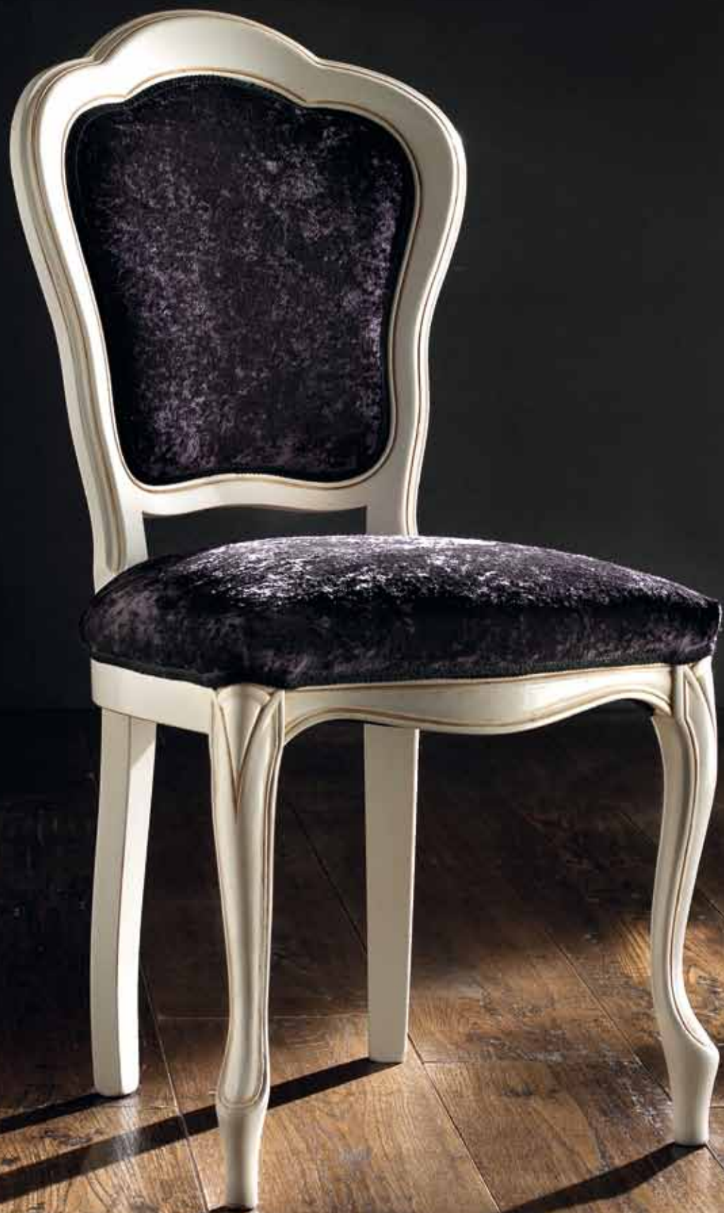
LT 160 Sedia tessuto velluto nero 25 Chair with black velvet fabric 25