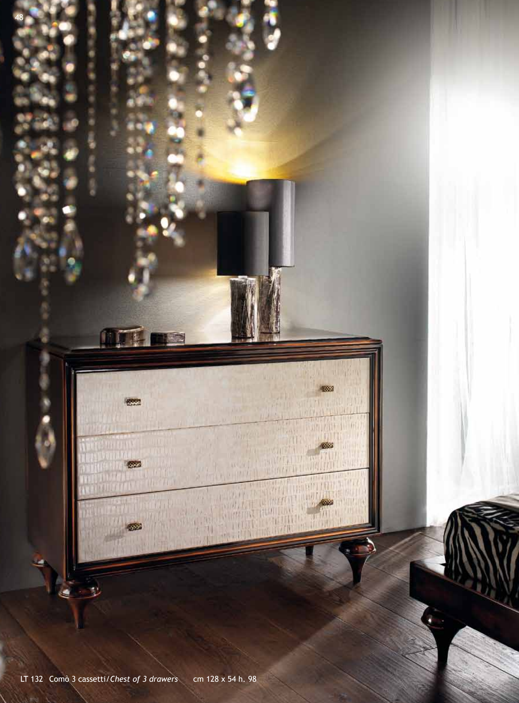
LT 132 Comò 3 cassetti / Chest of 3 drawers cm 128 x 54 h. 98