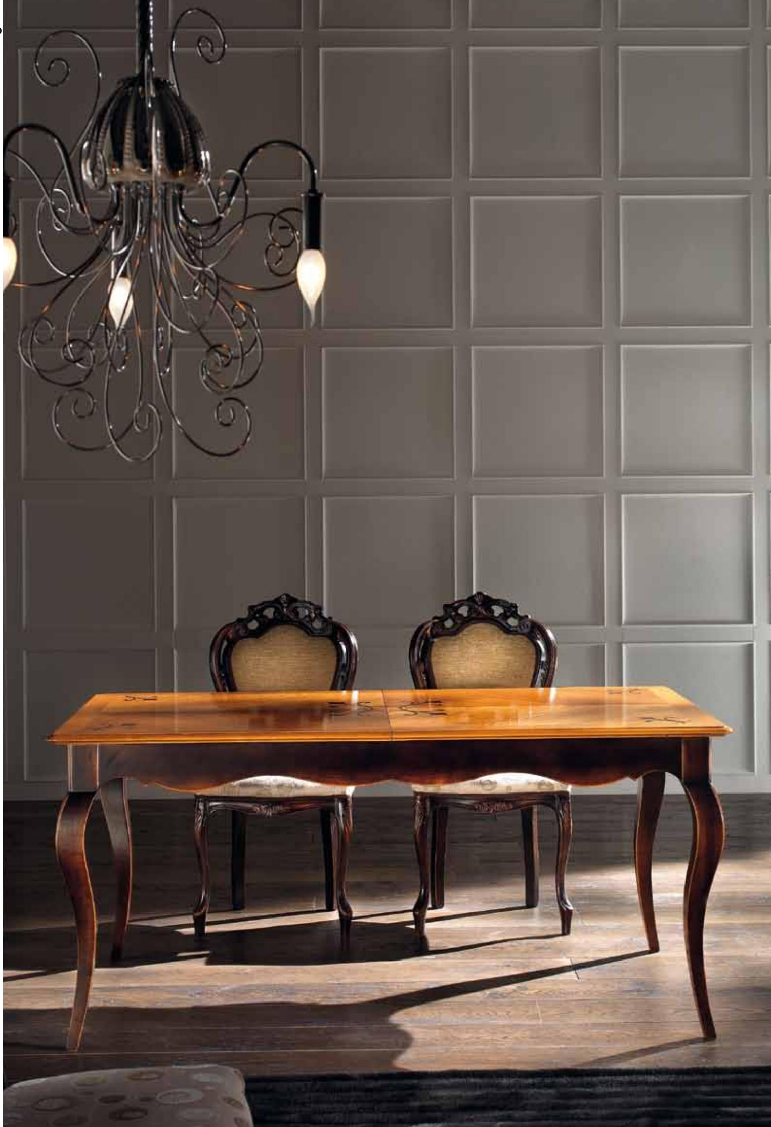
LT 122 Tavolo rettangolare all./Extensible rectangular table cm 170/280 x 95 h. 78