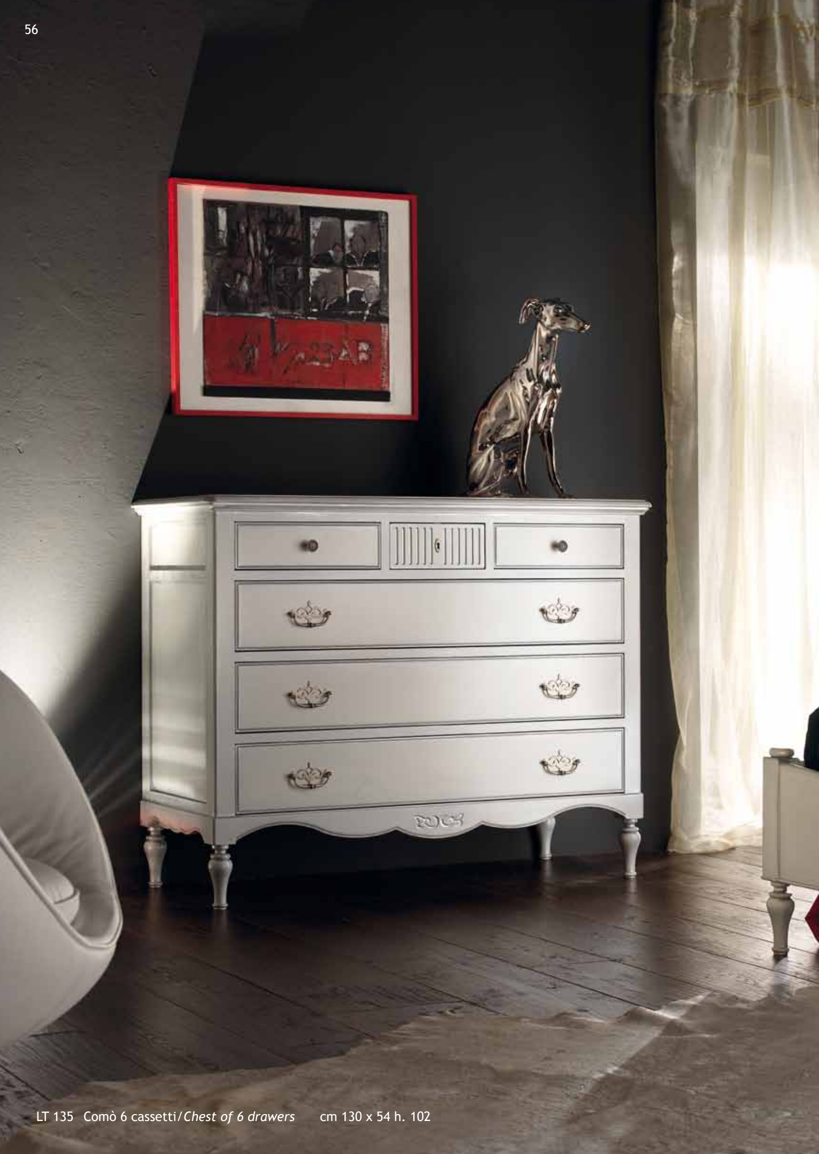
LT 135 Comò 6 cassetti/Chest of 6 drawers cm 130 x 54 h. 102