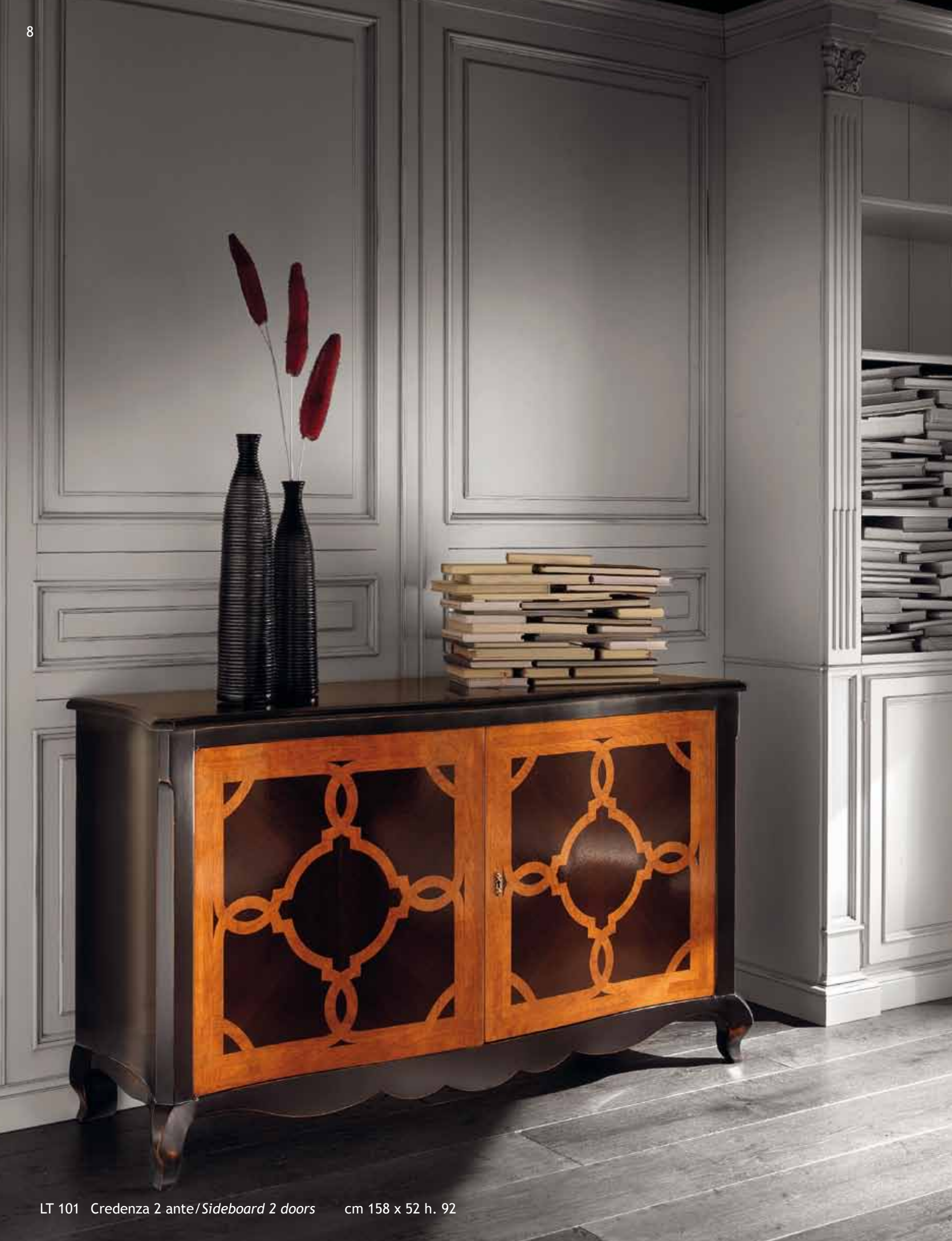
LT 101 Credenza 2 ante/Sideboard 2 doors cm 158 x 52 h. 92