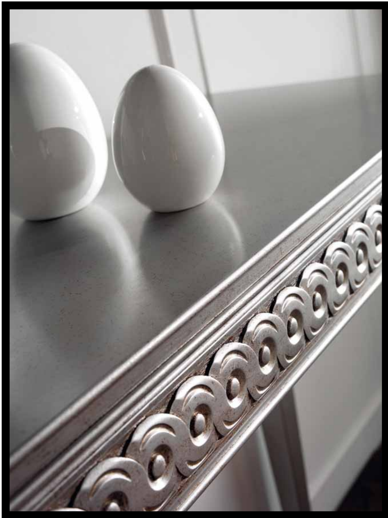
LT 111 Consolle/Console cm 140 x 40 h. 88 LT 1115 Specchiera/Mirror cm 100 x h. 100